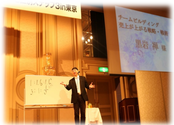
＜黒岩禅氏によるチームビルディング、売上げが上がる戦略・戦術＞